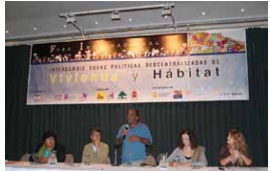
Fòrum internacional sobre polítiques descentralitzadores, La Paz 1 i 2 de febrer de 2012

Amb aquest objectiu en ment, el projecte va contemplar accions de formació, reflexió i investigació orientades a enfortir la presència dels grups de dones orga-