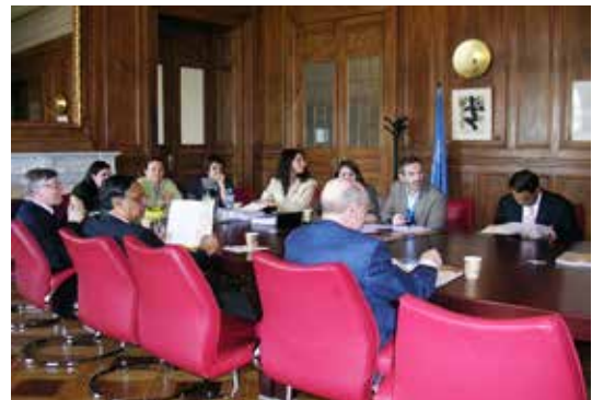
Presentació de l'informe alternatiu per part de les entitats socials davant els membres del Comitè DESC de Nacions Unides

Fruit d'aquesta tasca el Comitè va emetre unes dures recomanacions, en les quals subratlla la necessitat de que les mesures d'austeritat respectin el contingut mínim essencial dels drets reconeguts al Pacte de Drets econòmics, socials i culturals. A més, recorda la indivisibilitat, universalitat i interdependència de tots els drets humans i recomana a l'Estat que prengui les mesures adequades per assegurar la plena justiciabilitat i aplicabilitat de totes les disposicions del Pacte pels tribunals nacionals