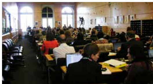
Sessió general del Comitè DESC de Nacions Unides

L'Informe, elaborat de manera conjunta per 19 organitzacions socials de l'estat espanyol es va presentar en el marc de la 48 a sessió del Comitè DESC el maig de 2012. El document posa de relleu el creixent deteriorament de les condicions de vida de gran part de la població i les impor-